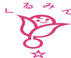
くるみん認定マーク

※次世代支援対策推進法に基づいた行動計画の策定・届出を行い、その行動計画に定めた目標を達成するなどの一定の要件を満たした場合、「子育てサポート企業」としての認定（くるみん認定）を受けることができます。